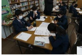
←テーマについての課題と課題解決方法をみんなで協議しました！