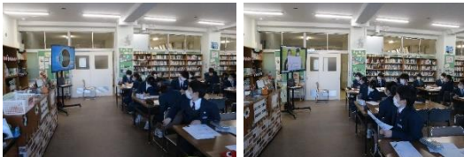
←DVDでスマホと健康について学びました！ 領家小保健委員会による動画を視聴しました！