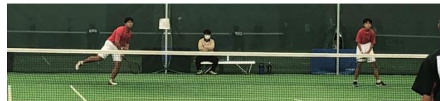
写真は個人情報保護の観点から一部加工しています