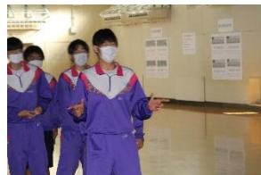
2年生はみんな必死になっていました。