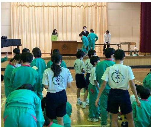
1年生のビンゴでは豪華景品も。

長い2学期を頑張ったご褒美に、学年ごとにレクリエーションを行いました。どの学年も、学年委員が中心となり、学年みんなで楽しめるレクを考えました。3年生は、「人借競争」と「部活動リレー」。2年生は「ジェスチャー伝達ゲーム」と「一筆書きゲーム」。1年生は「サンタとナカイのプレゼントリレー」と「思いやりビンゴ」を行いました。どの生徒も笑顔が溢れ、とても楽しい時間を過ごすことができました。