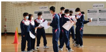
3年生は受験勉強の息抜きになりました。