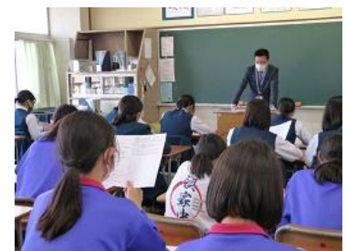
部活動ミーティングの様子