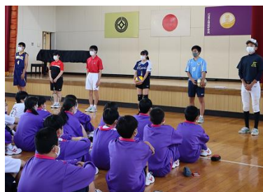
新入生オリエンテーションの様子